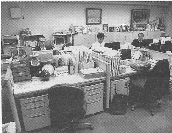
出版部の営業・経理部門

同社の事例は、専門分野の出版と店舗がシステムで連携し、しっかりと顧客をつなぎ止めているといえるだろう。