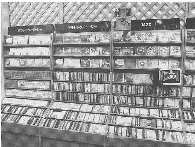
クラシックやジャズも豊富に揃える。