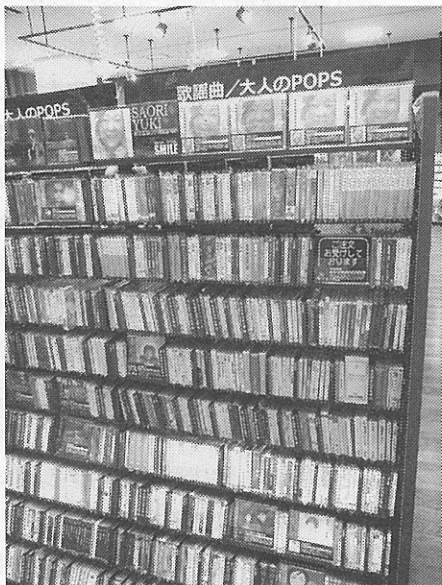
60～70 年代の懐かしいポップスも豊富に品揃え。

シック、ジャズ、演歌、そして 60～70 年代のポップス中心に集めた「大人の POPS」といった棚も大きくスペースをとっている。