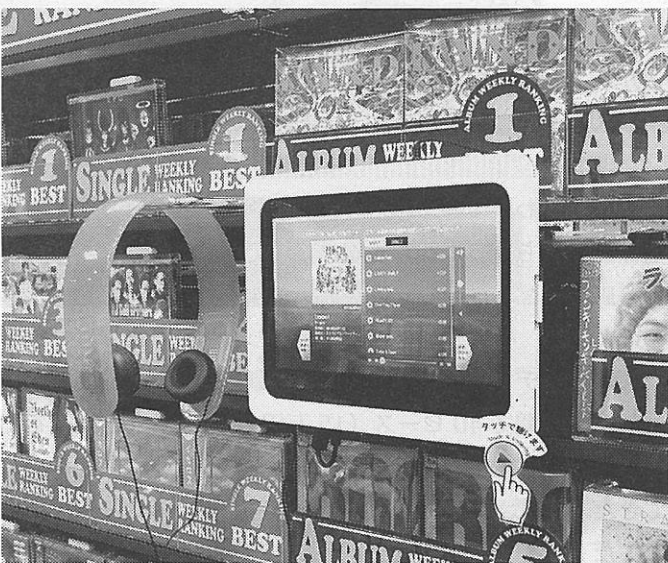
棚には専用什器で固定。什器は平台用、移動什器用もある。

また、導入費用は、「リスニングポッド XV」(毎月の基本料金 2 万円 (店舗光回線)、端末使用料 1400 円) を導入していれば、子機の「LPOD Play」は月額使用料 900 円、端末利用料と情報セキュリティ料 2000 円の計 2900 円で導入できるため、「月々の費用がこれまでより安価で、小さな店舗でも負担が少ない」と導入効果を語る。