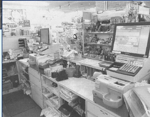
POS レジ 2台で「Book Answer3」を活用