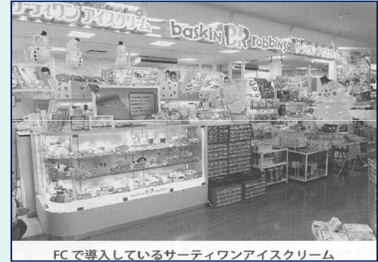
FCで導入しているサーティワンアイスクリーム