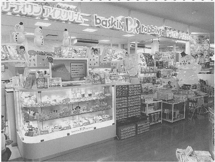
FC で導入しているサーティワンアイスクリーム

光和コンピューターでは「ご要望を即座に反映できる開発スタンスをとっていきます」としている。