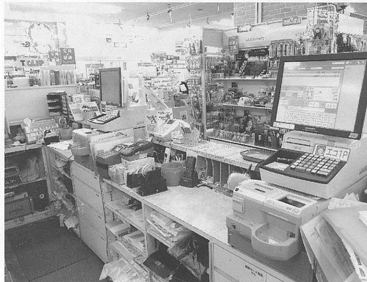
POS レジ 2 台で「BookAnswer3」を活用

「BookAnswer3」を導入して約半年たつが、曾根店長は「コードを入れないとヒットしないなど検索機能に改善点があるほか、返品データの入帳処理や在庫管理などに課題も見えてきました」という。