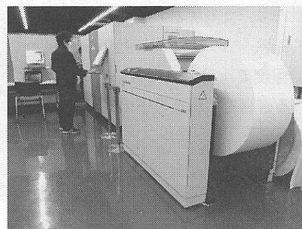
ロール紙に印刷する SCREEN のデジタル印刷機「Truepress Jet520」

数の出版物をロール紙 (輪転機) に一括印刷することができる「付け合わせ印刷 (JOB ギャングング)」が可能のため、違う銘柄の出版物を同じロールにまとめて印刷することで、1冊からの製作も低コストで行うことができる。こうして1冊あたりの製作費も低く抑えられるのが特徴。