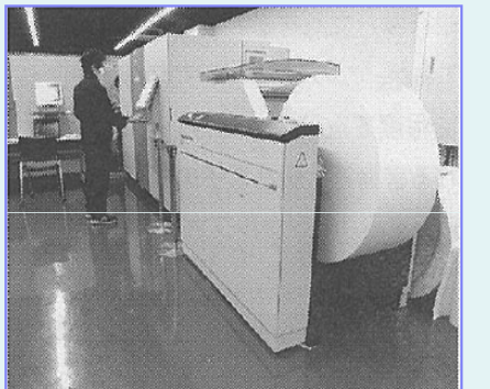
ロール紙に印刷する SCREEN のデジタル印刷機「Truepress Jet520」

出版システム開発・販売の光和コンピューターと大日本スクリーン製造 (SCREEN)は、7月2日から開幕する東京国際ブックフェア(TIBF)に共同出展し、このほど両社などが立ち上げた協業事業「デジタル・オンデマンド出版センター(DOD出版センター)」が提供する低コストで少部数の出版を可能にする新しい出版形式「デジタル・オンデマンドブック」を提案する。