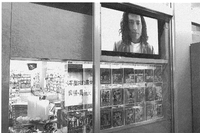
新刊を紹介するレコメンド棚

このほかにも、クラウドシステムを採用している点をあげて、「以前の POS システムでは、エラーが起こると復旧までに時間がかかってしまい、2 台 POS を入れていても、お客様を待たせてしまっていた。すぐに復旧できる点も魅力的」と話す。