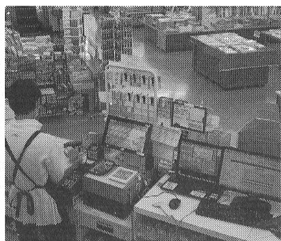
レジカウンターは店内に1カ所

23時閉店だが、すぐにはシャッターを閉めず、閉店時間ぎりぎりに入店した人の書籍検索、購入にも対応。実質は5分過ぎぐらいまでは営業しており、お客さんにとってはうれしい対応だ。