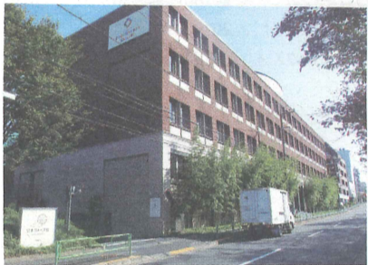
東京メトロ丸の内線 中野富士見町駅から徒歩約520メートルの新社屋