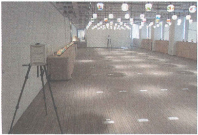
500平方メートルのCRAFTING ART GALLERY

クラフト、ハンドメイドの分野で出版や教育、イベントなど多角的な事業を展開する日本ヴォーグ社は、2017年に本社社屋を移転し展示会やセミナーなどのスペースを拡大。商品・サービス別だった組織をジャンル別の5つのディビジョンに再編するなど新たな時代に向けた取り組みを強化。システムではこのほど新OSに対応する経理システムを導入した。また、今年には三浦百恵さんの作品集『時間の花束』の大ヒットといううれしいニュースもあった。