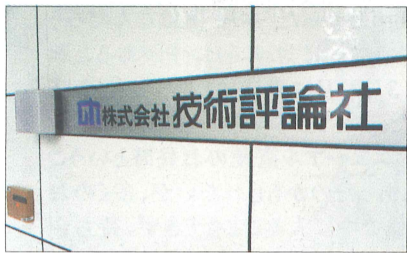
東京の市谷に本社ビルをおく

コンピューター書のイメージが強い技術評論社は近年、ビジネス書など一般書分野でも勢いが出ている。このところの新型コロナウイルス感染拡大でも、細菌、ウイルス、パンデミックなどを扱う既刊に注目が集まっている。こうした出版活動を支えるのはクラウドで運用するシステムだ。